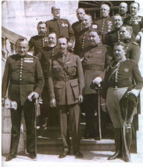
Alfonso XIII y el Directorio militar